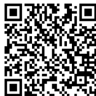
スポーツエントリーズチェック確認表