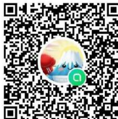
UJ フレッシュ連絡用オープンチャット