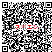
スポーツエントリーズチェック確認表